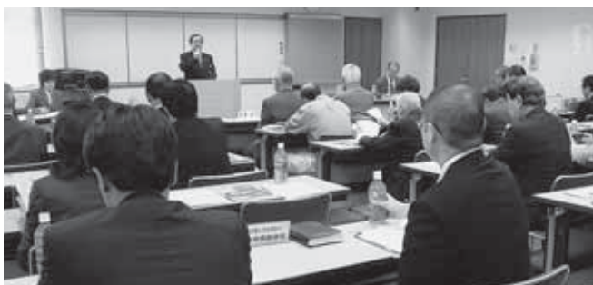
第 1 回 理事会

第二十六回総会議案について・二十二年度の会員増強褒賞・厚生事業優良表彰・功労者表彰を主体に協議した。