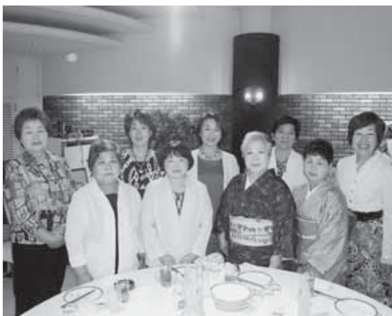
懇親会女性部会役員