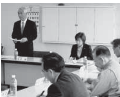
第 2 回 組織委員会