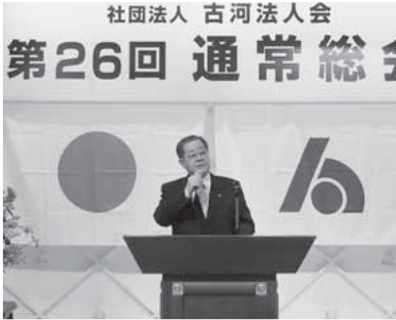
弓削会長あいさつ